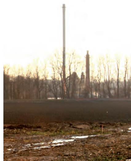
Dossier complet de l'enquête de KTT-iMA sur notre site arbres.asso.fr

cadre de nos rencontres régulières avec la direction de Wienerberger : ils confirment la présence persistante des odeurs qui proviendraient des lieux de stockage. En prévention de ces nuisances olfactives, et suivant les recommandations de KTT-iMA, Wienerberger a pris l'engagement de construire un hangar pour mettre les boues de papeterie à l'abri des intempéries, et éviter ainsi la propagation des odeurs. Excellente idée qu'ARBRES avait d'ailleurs suggéré à Wienerberger avant la construction de la cheminée en 2007. Reste maintenant à déposer le permis de construire, puis à financer les travaux... nous comptons sur le concours des élus pour activer la partie administrative de ce dossier, et sur l'industriel pour réaliser ce projet dès 2013 et non pas 2014 comme actuellement projeté.