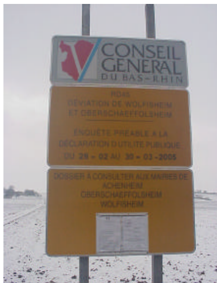
Avis de l'enquête publique placardée autour d'Oberschaeffolsheim et d'Achenheim en 2005... Les nouveaux opposants n'avaient rien vu à l'époque?